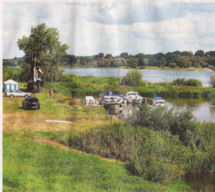
Ein Blick auf den kleinen Sportboothafen und die Elbe. Die schöne Lage am Fluss prägt das Dorf. 2. Aufl.: T. Janssen

Klagemutter“, lacht Heike Dinkel. Auch ältere Kunden erzählen oft, was sie bewegt.